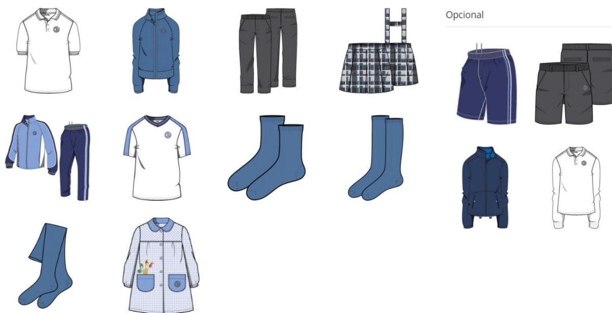
CALENDARIO DE IMPLANTACIÓN DEL UNIFORME EN EL CENTRO